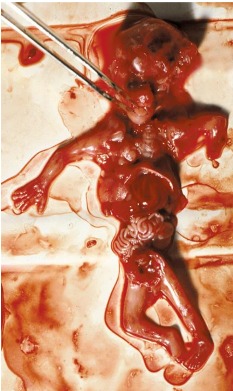
Аборт в 10 недель