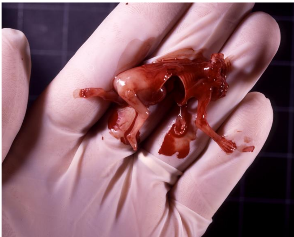
Аборт в 11 недель