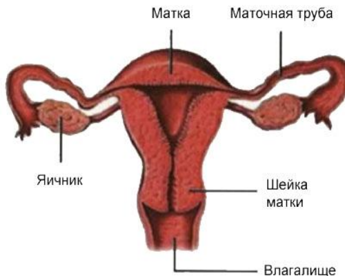
Женская половая система

Началом новой человеческой жизни является зачатие. Через несколько часов после полового акта внутри организма женщины (см. рисунок) происходит слияние яйцеклетки и сперматозоида.