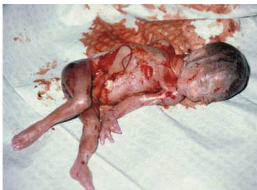
Аборт в 22 недели