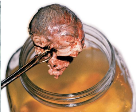
Аборт в 26 недель